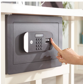
Ouverture via code PIN et empreinte digitale