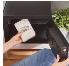
Verrouillage motorisé avec deux pênes de 20 mm, porte découpée au laser et plaque anti-perçage pour une protection maximale contre l'effraction